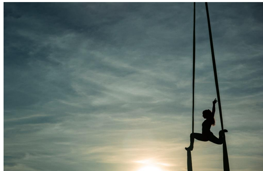
Photo Concours Fondation Alliance Française : « Objectif Sport ! »